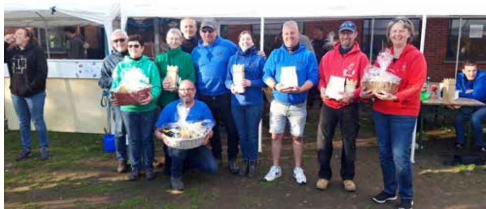
Finalisten B reeks