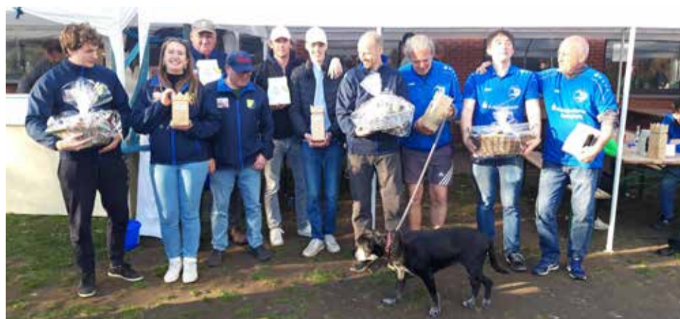
Finalisten A reeks