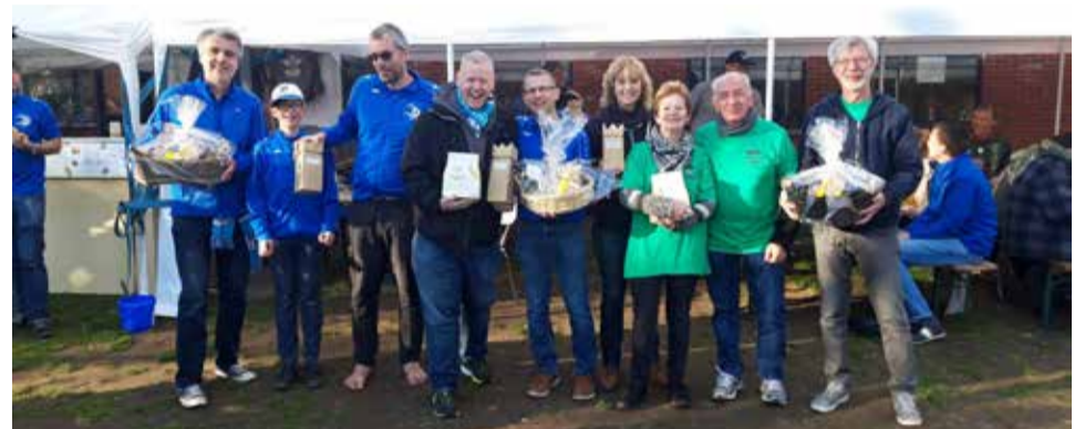
Finalisten C reeks